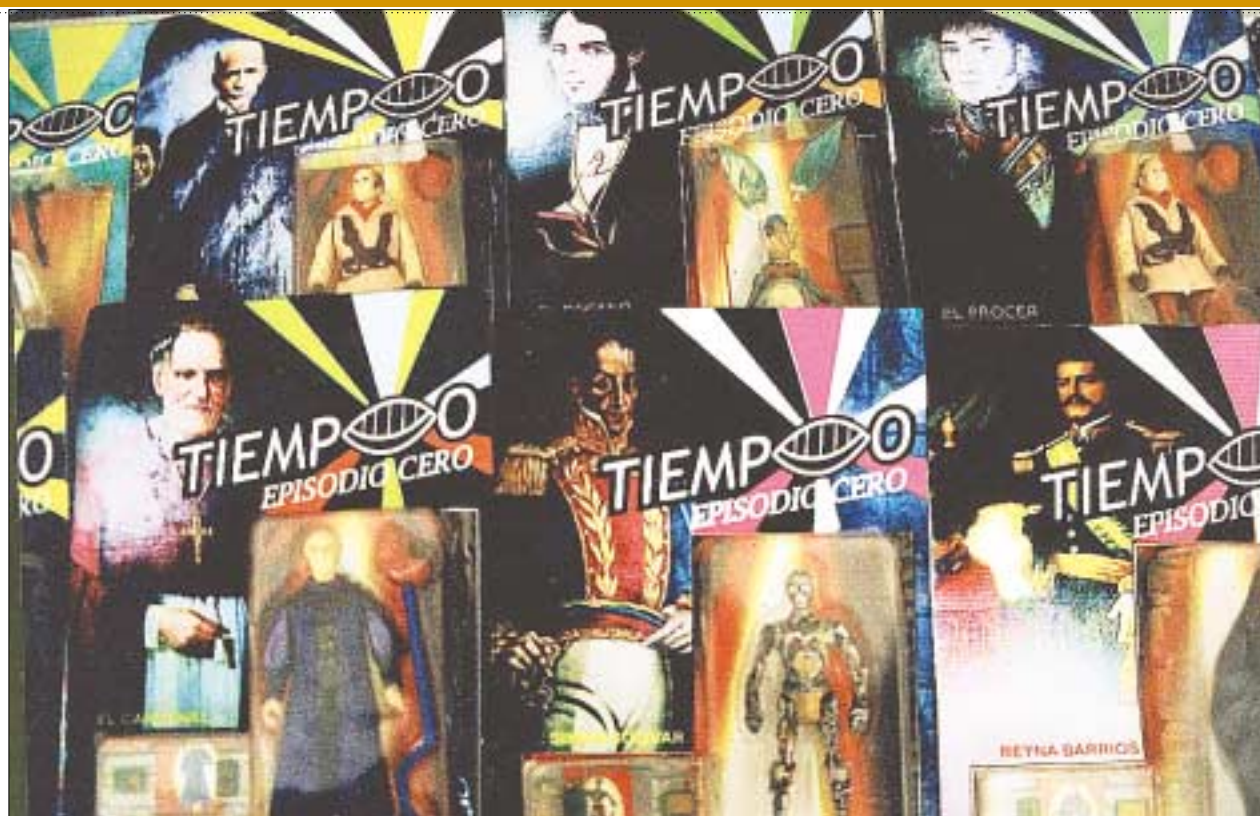
Algunas de las propuestas se censuran por las autoridades. Es el caso de esta intervención en el Museo Nacional de Historia, con la venta de personajes como souvenirs, obra de Alvarez y Payeras.