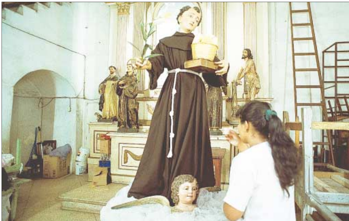
Las mujeres son las principales devotas de San Antonio, quienes lo veneran y le hacen peticiones cada 13 de junio.