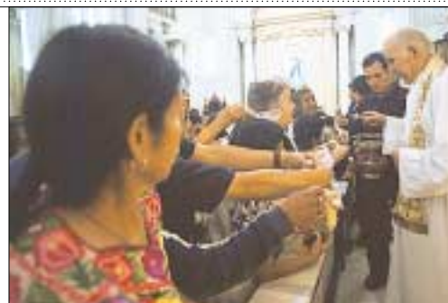
La bendición de los panes se realiza durante la misa de las 10 de la mañana